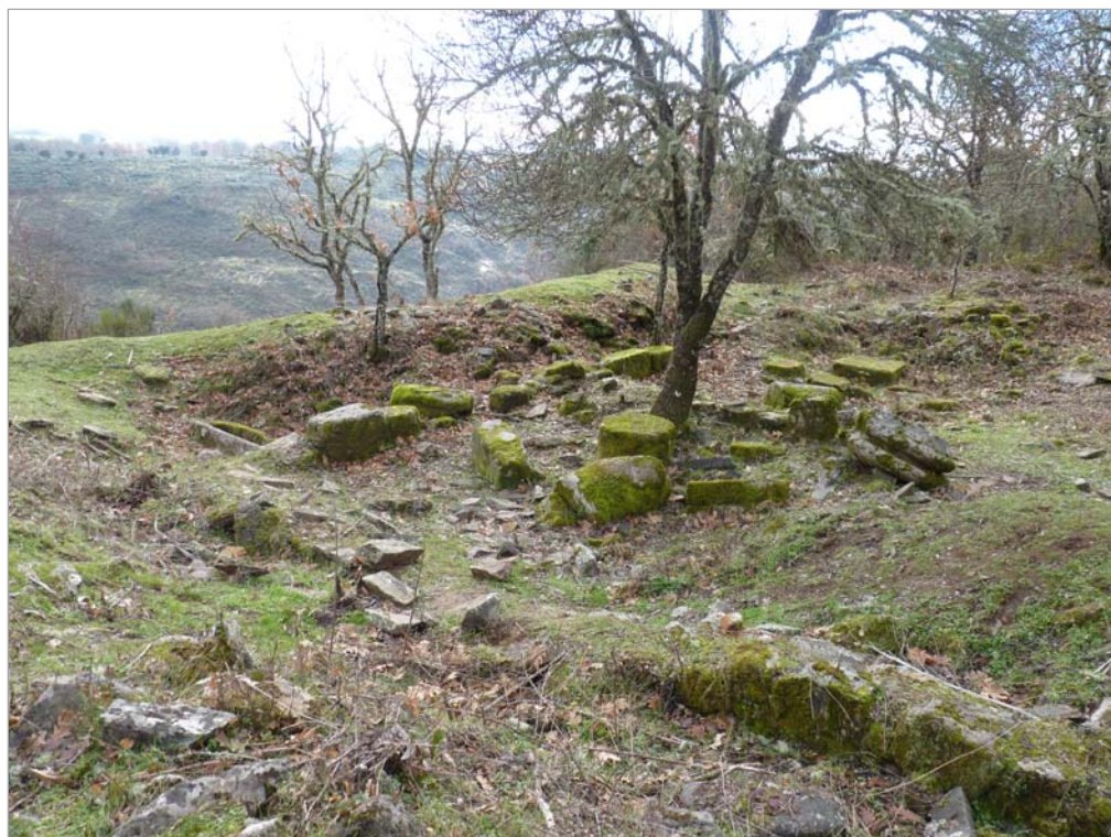
El Palacio / La Plaza en la actualidad