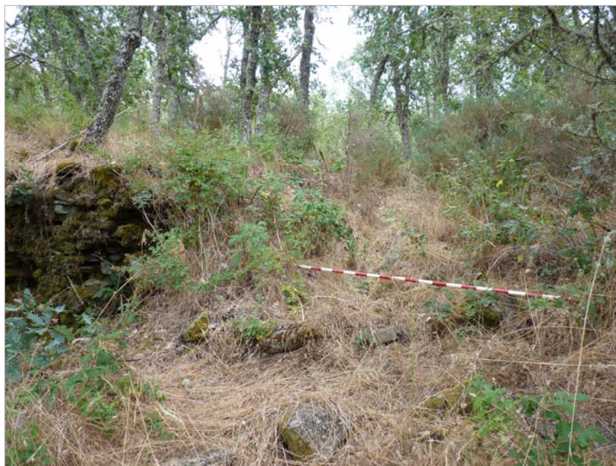
Fig. 5.- Ubicación aproximada del otro sondeo que se efectuara; lienzo occidental de muralla que circunda el castro por ese lado. Es por este lateral por el que mejor se conserva la muralla. El vano de la fotografía tal vez indicaría la existencia de una de las puertas del recinto, algo que intentará ser verificado.