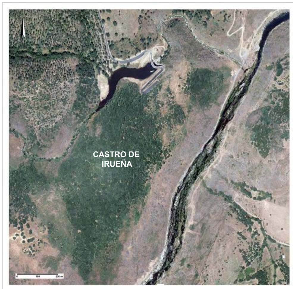
Fig. 1.- El núcleo del yacimiento, localizado en la mayor parte de su extensión en la masa forestal visible en la fotografía entre el arroyo Roloso, que discurre por el oeste, y el río Águeda, que lo hace por el este (tomado del JIMÉNEZ, LEÓN y MARCOS, 2014).