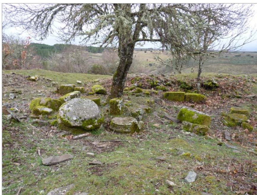
Figs. 3 y 4.- Zona de excavación de los años treinta. Fotografía tomada tras los desbroces efectuados por el Ayuntamiento de la población en 2016-2017. Se limpiará de tierras y sedimentos esta zona y se realizará uno de los dos sondeos preceptivos.